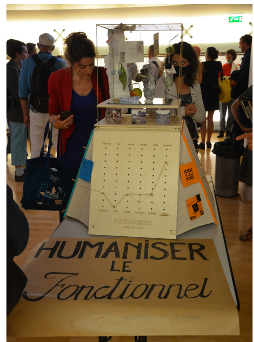
RIM 2021 : ateliers exploratoires, grand banquet, projections et présentation des ambiançomètres.