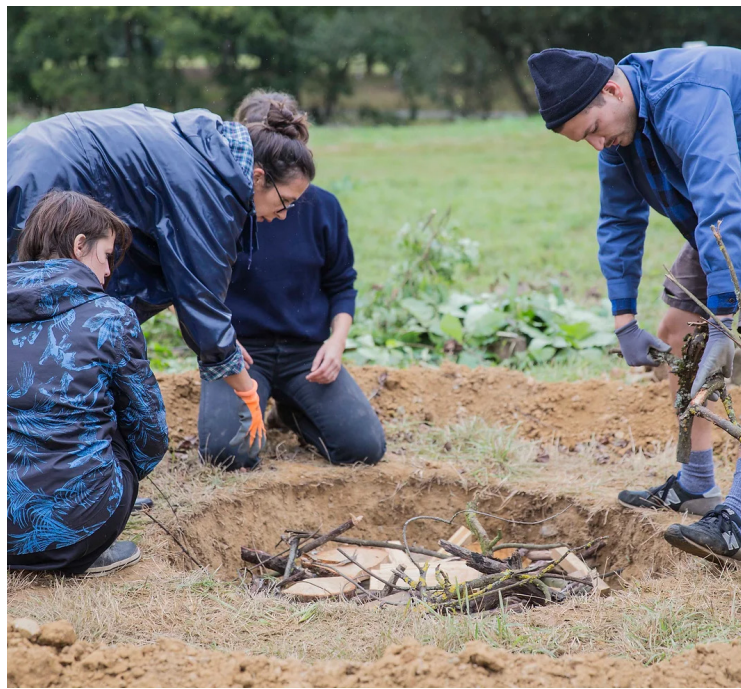
RIM 2019 : performance artistique et repas collectif autour de la ruine.