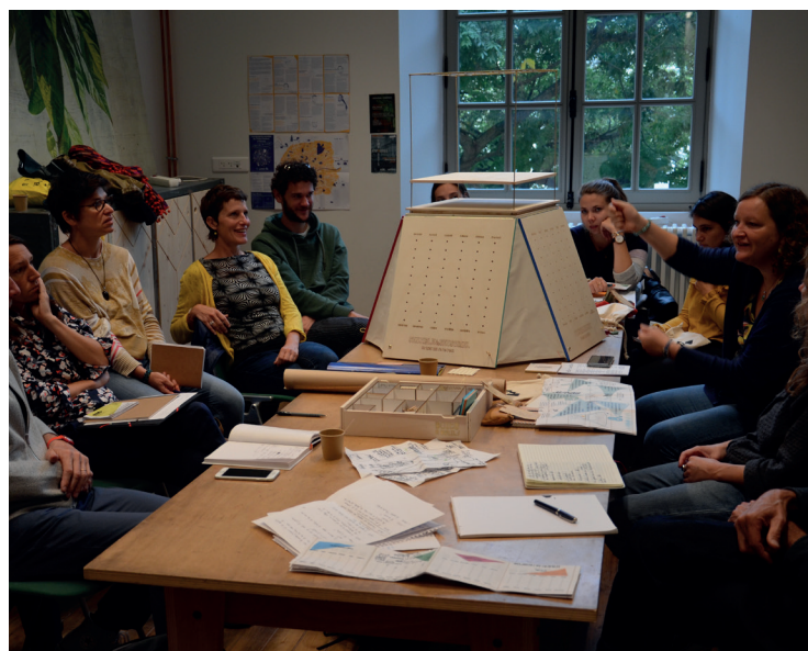
L'ambiançomètre, Lost and Find.

Lors de chaque édition, un collectif s'est prêté à l'exercice pour inventer une architecture nomade, un outil de recherche-action témoignant de la diversité des interactions et des sujets débattus en inter-monde. En 2021, l'ambiançomètre, outil de recherche-action a été fabriqué par les architectes de Lost and Find.