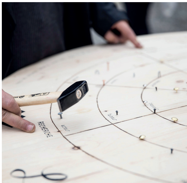
La table des mondes en présence, Les Animé.e.s