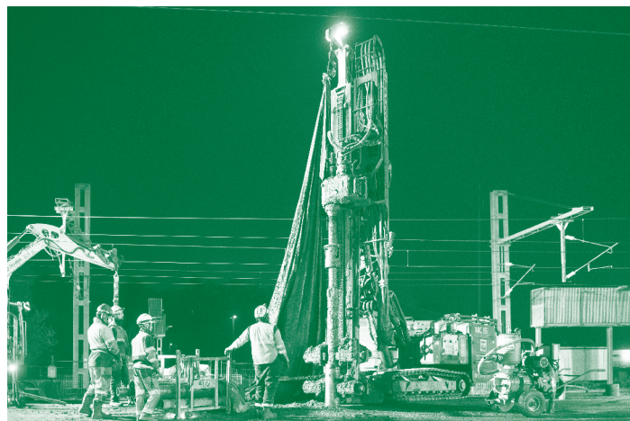
Finalisation des micro-pieux de nuit

Les fondations de la passerelle ont été finalisées fin mai. Les ouvriers ont travaillé de nuit pour pouvoir intervenir sur les quais de la gare. À partir de juin et jusqu'à mi-août, les différents éléments de la passerelle seront posés (les piles et les escaliers de la passerelle).