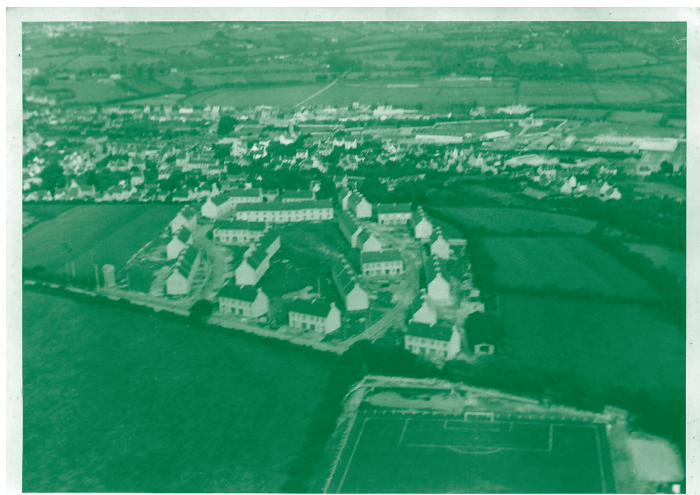
La cité des Castors du rail à Ergué-Armel (aujourd'hui rue de Rozulen). Vue aérienne du milieu des années 1950.

La société, dont le siège est situé rue Saint-Julien à Ergué-Armel, voit ses actions réparties entre 71 cheminots. Elle est administrée par un conseil de douze membres tirés au sort puis renouvelé par tiers. Régie par un règlement qui fixe les montants à verser au début du projet et mensuellement, la société des Castors du rail facilite l'épargne des actionnaires et l'obtention d'un prêt de 119 millions d'anciens francs. Cependant, elle bénéficie aussi de primes à la construction de la part de l'État et d'aides directes de la commune d'Ergué-Armel (bitumages, revêtements, pose de canalisations d'eau et d'électricité). Cette coopérative d'autoconstruction constitue un moyen d'accéder à la propriété pour une classe ouvrière modeste, avec un type d'habitat considéré comme du logement social. Lancé en 1953, sur une parcelle agricole de plus de trois hectares au lieu-dit de Rozolen, le chantier de la cité des Castors du rail dure trois ans. 71 maisons sortent de terre, élevées sur une cave, avec une pièce de plain-pied et un faux grenier, et toutes équipées du confort moderne.