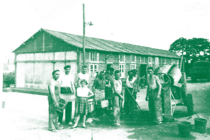
Les castors du rail en action. Photographie des années 1950.

À l'image d'autres autoconstructions coopératives, les membres de la société apportent chacun leur savoir-faire pour mener à bien le projet. Chaque sociétaire doit fournir 36 heures de travail mensuelles, être présent deux dimanches par mois et consacrer deux semaines de congés annuels au chantier, durées qui augmentent progressivement. Ainsi, les cheminots procèdent au défrichage de la parcelle, à l'empierrement et au terrassement de la route. Ils extraient les pierres dans une carrière à Plomelin, fabriquent eux-mêmes 20 000 parpaings. La solidarité est de mise, le règlement prévoyant qu'en cas de décès de l'un des membres de la société, les autres « Castors » s'engagent à terminer le chantier pour sa veuve. Les premiers habitants emménagent en 1955. La rue de Rozolen témoigne encore aujourd'hui de cette épopée cheminote et collective d'après-guerre.