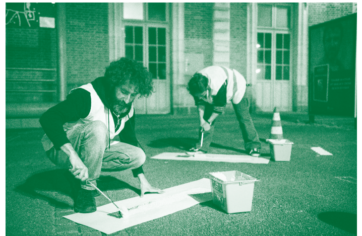
Peinture de la fresque de nuit @Jean-Jacques Banide - QBO