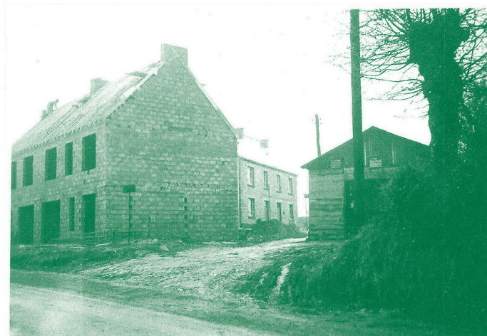
Les maisons en chantier. Photographie des années 1950.