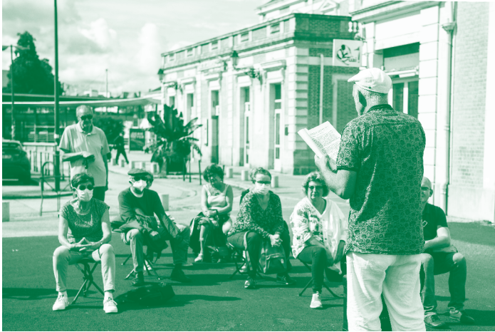
La traversée du présent. Rendez-vous de la Gare 2021