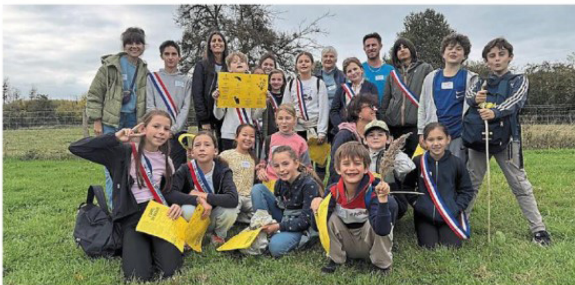
Les conseils municipaux des jeunes de Deauville, Touques et Trouville-sur-Mer lors du premier atelier de sensibilisation à l'Estuaire de la Touques, mercredi 8 octobre, à l'Espace naturel sensible du marais de la Touques.

Ces ateliers s'inscrivent dans le cadre de l'élaboration du Plan guide de l'estuaire de la Touques, un document stratégique d'aménagement et de valorisation porté par la CCCF, conduit par un groupement pluridisciplinaire d'experts. Le programme associe une vingtaine de représentants des conseils municipaux des jeunes de Deauville, Touques et Trouville-sur-Mer, leur conférant un rôle de participation citoyenne dans la réflexion collective autour du Plan guide. Au fil des séances, ils participent à des explorations, ateliers et visites, dans une logique de découverte et de coconstruction. L'objectif est également de produire des supports pédagogiques (récits, illustrations, expositions), destinés à un public plus large.