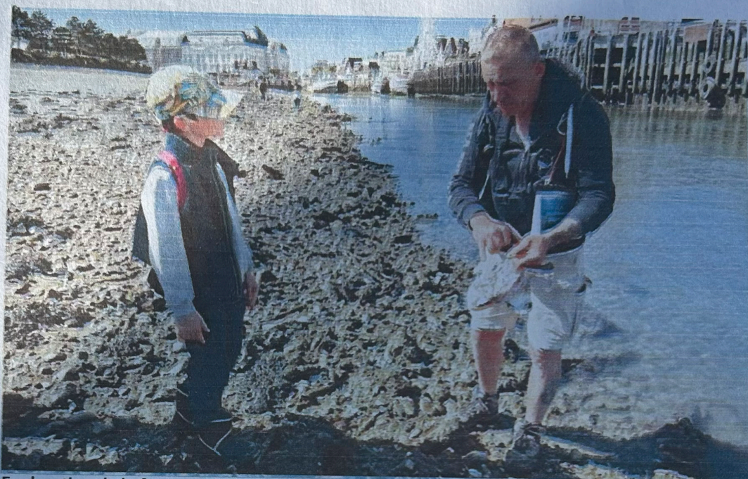
Exploration de la faune et de la flore de la Touques, entre Deauville et Trouville-sur-Mer, près de l'estuaire avec les Conseils Municipaux des Jeunes de Deauville, Touques et Trouville-sur-Mer.