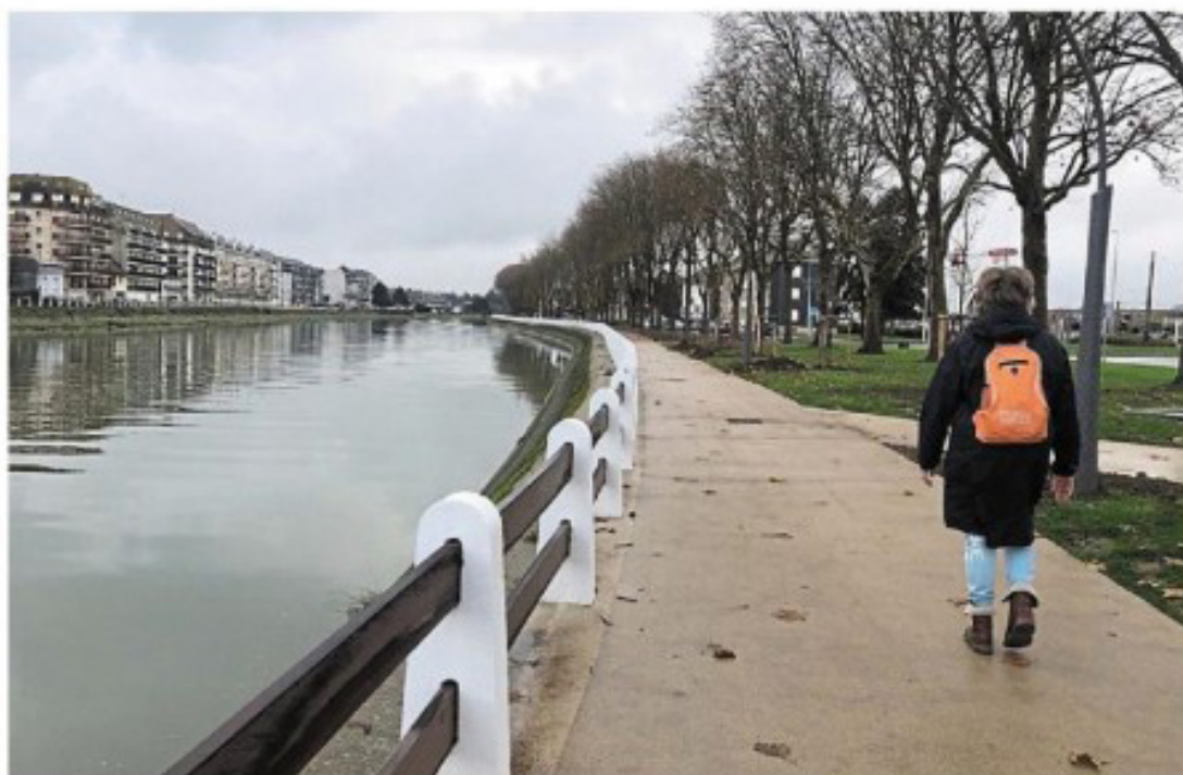
Un plan guide d'aménagement des berges de la Touques est en préparation au sein de la communauté de communes Cœur Côte fleurie.