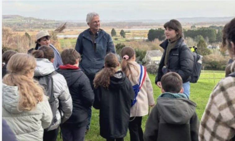
Poursuite de la séance aux écuries de Lisors à Saint-Arnoult.

Après une immersion dans le marais de la Touques en octobre dernier, la troisième séance du programme de sensibilisation à l'Estuaire de la Touques a réuni mercredi dernier les conseils municipaux des jeunes de Deauville, Touques et Trouville-sur-Mer pour une nouvelle étape intitulée « Retour aux sources ». Une nouvelle visite qui s'inscrit dans ce programme mené par la Communauté de communes et « pensé comme un parcours éducatif et artistique », invitant « les jeunes à affiner leur regard sur le vivant, explorer autrement leur environne-