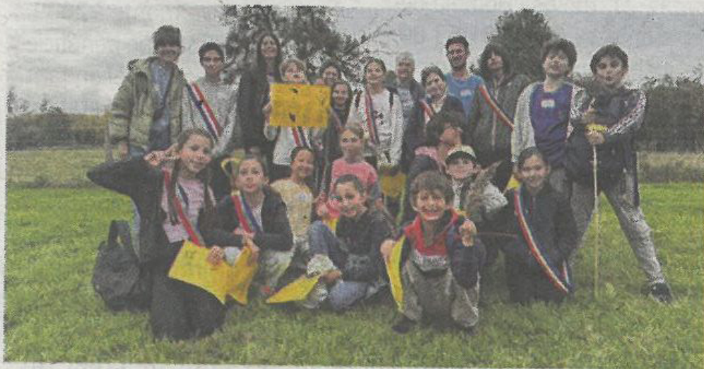
Les conseils municipaux des jeunes au coeur du marais de la Touques. Cœur Côte fleurie

Au cours de cette balade, les jeunes ont découvert la richesse écologique du site. Au menu : « observation et cartographie des plantes et des petits habitants du marais, prise de rôles d'experts, imagination d'un bateau sur l'estuaire de la Touques, et partage de connaissances avec Marie-Pierre de l'association Touques Randonnées, depuis la cabane d'observation des oiseaux », raconte la Communauté de communes Cœur Côte fleurie dans un communiqué. Par ailleurs, ils ont également « inventé des histoires inspirées du lieu, avant de réaliser une restitution collective » et un binôme de participants