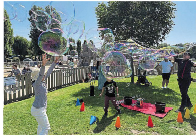
L'animation « bulles de savon » des Fabuleuses a suscité beaucoup d'enthousiasme auprès des enfants lors de la Fête de l'Estuaire de la Touques ce week-end des 13 et 14 juin.

Ce week-end, la 2 e édition de la Fête de l'estuaire de la Touques était dédiée à la gestion de l'eau sur le territoire local. De nombreuses activités étaient organisées.