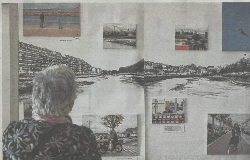
Des habitants participent à des ateliers pour réfléchir à l'avenir de l'estuaire de la Touques. MMR

Un relief particulier entre coteaux, plateaux, vallée, marais et mer, une urbanisation rapide ayant « canalisé » la Touques et créé des îlots de chaleur, risques liés à l'eau, une biodiversité fragilisée par l'artificialisation : dans une petite exposition, synthèse du diagnostic mené, les meneurs de projets rappellent les grands enjeux. Un état des lieux technique, mais aussi humain pour mieux comprendre les usages du fleuve, les représentations du risque inondation, les envies pour demain. Sur une grande banderole, des témoignages et