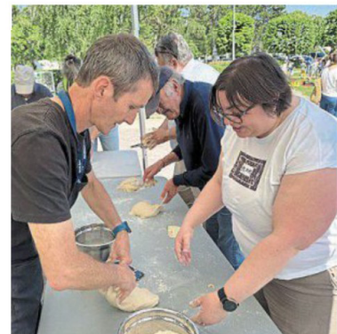
Une activité fabrication du pain était aussi proposée.

Les projets sont nombreux sur la réutilisation des eaux usées : « On n'attend plus que l'autorisation du préfet pour être en mesure de fournir l'eau pour les espaces verts publics. Tout est prêt, on va pouvoir bientôt fournir l'eau pour nos villes, mais cela nécessite encore des aménagements. »