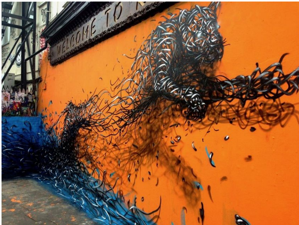
© cMsSaraKelly. Graffiti in Shoreditch, London - Leaping Tiger by DAleast.

Cet été, trois fresques géantes signées des street artistes DAleast et David de la Mano vont faire leur apparition en centre-ville notamment sur la façade du magasin Maxi Bazar (ex 5e avenue) esplanade des droits de l'homme et boulevard Léon Blum entre la mairie et le front de mer.