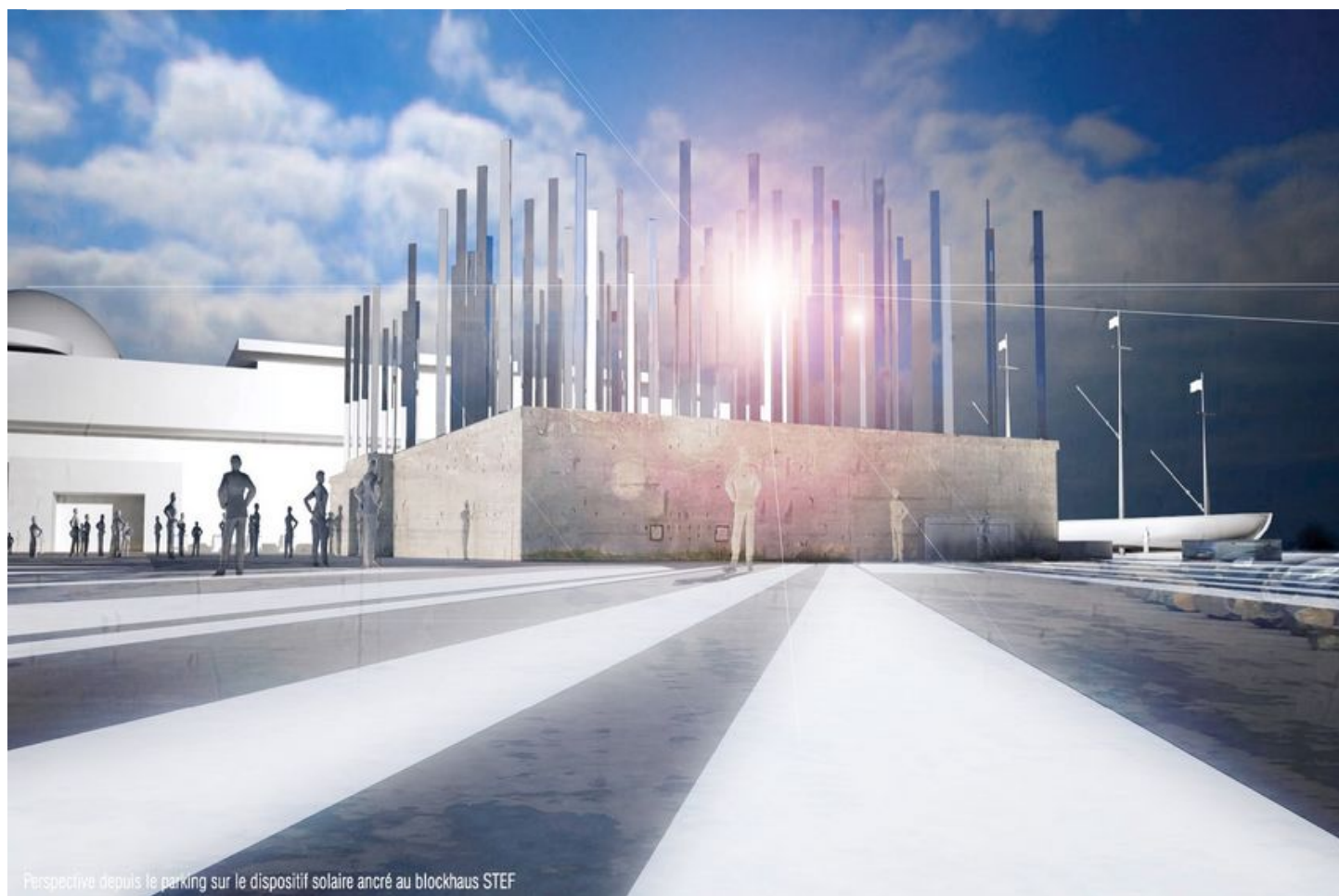
Perspective depuis le parking sur le dispositif solaire ancré au blockhaus STEF

Plusieurs nouvelles réalisations artistiques sont déjà installées dans la ville ou le seront dans les mois qui viennent. Travail d'un artiste, d'un collectif d'artistes, participation des habitant.e.s, technique mixte, graff, sculpture, sur une architecture ou du mobilier urbain... toutes ces nouvelles propositions répondent à une ou plusieurs des thématiques de la stratégie de la Ville en matière d'art public.