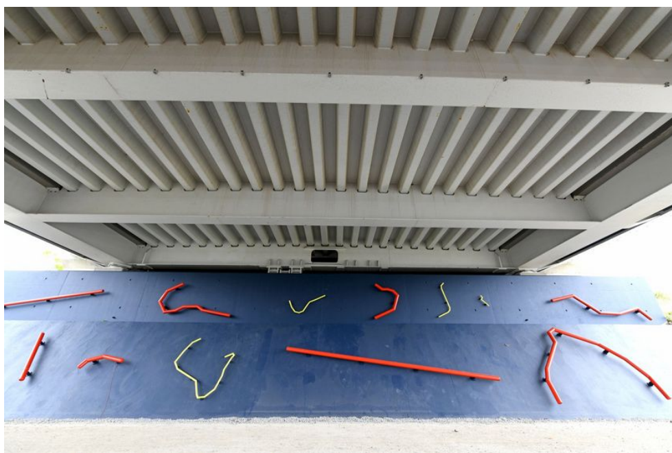
"Lignes de Désirs" par Julien Nédélec sous le pont de la Matte.

C'est la dernière-née des œuvres d'art nazairiennes : «Lignes de désirs» a pris ses quartiers sous le Pont de la Matte fin mai. Avec ces tubes d'acier rouges et jaunes sur fond bleu, le plasticien Julien Nédélec s'inspire des chemins de traverse pris par les piétons et rend hommage aux grands voyages transatlantiques. Une œuvre qui s'inscrit dans l'axe « XXL vs XXS ». «Le titre de l'œuvre vient d'une expression d'urbanisme qui nomme ces chemins « non prévus » par le plan d'urbanisme et qui sont tracés par les passages répétés des usagers. Saint-Nazaire est principalement un lieu où l'on arrive et son bord de mer invite à un voyage maritime qui se continuerait en vrai ou en rêve. J'ai décidé de chercher les principales routes maritimes mondiales et d'en faire les lignes de désirs de ce projet. Cette œuvre, à la fois abstraite et figurative, fait appel à l'imaginaire", explique-t-il.