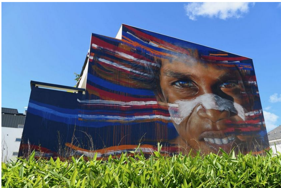
Portrait d'une jeune aborigène, Matt Adnate 2018 - Immeuble Caraïbes en face du Théâtre.

La période estivale sera aussi l'occasion pour les habitants de participer à l'installation «Éclats» sur le blockhaus des anciens frigos Stef . Une œuvre collaborative qui illustre parfaitement les axes « art et société » et « art-sciences-environnement ». [MAJ 22/07/2019] : L'installation de l'oeuvre participative "Eclats" est annulée.