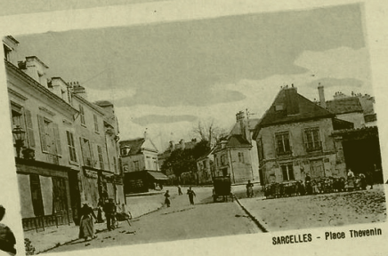
SARCELLES - Place Thevenin